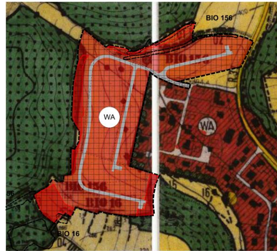
Auszug aus der 2. Änderung Flächennutzungs- plan der Marktgemeinde Nittendorf (21.06.2016)